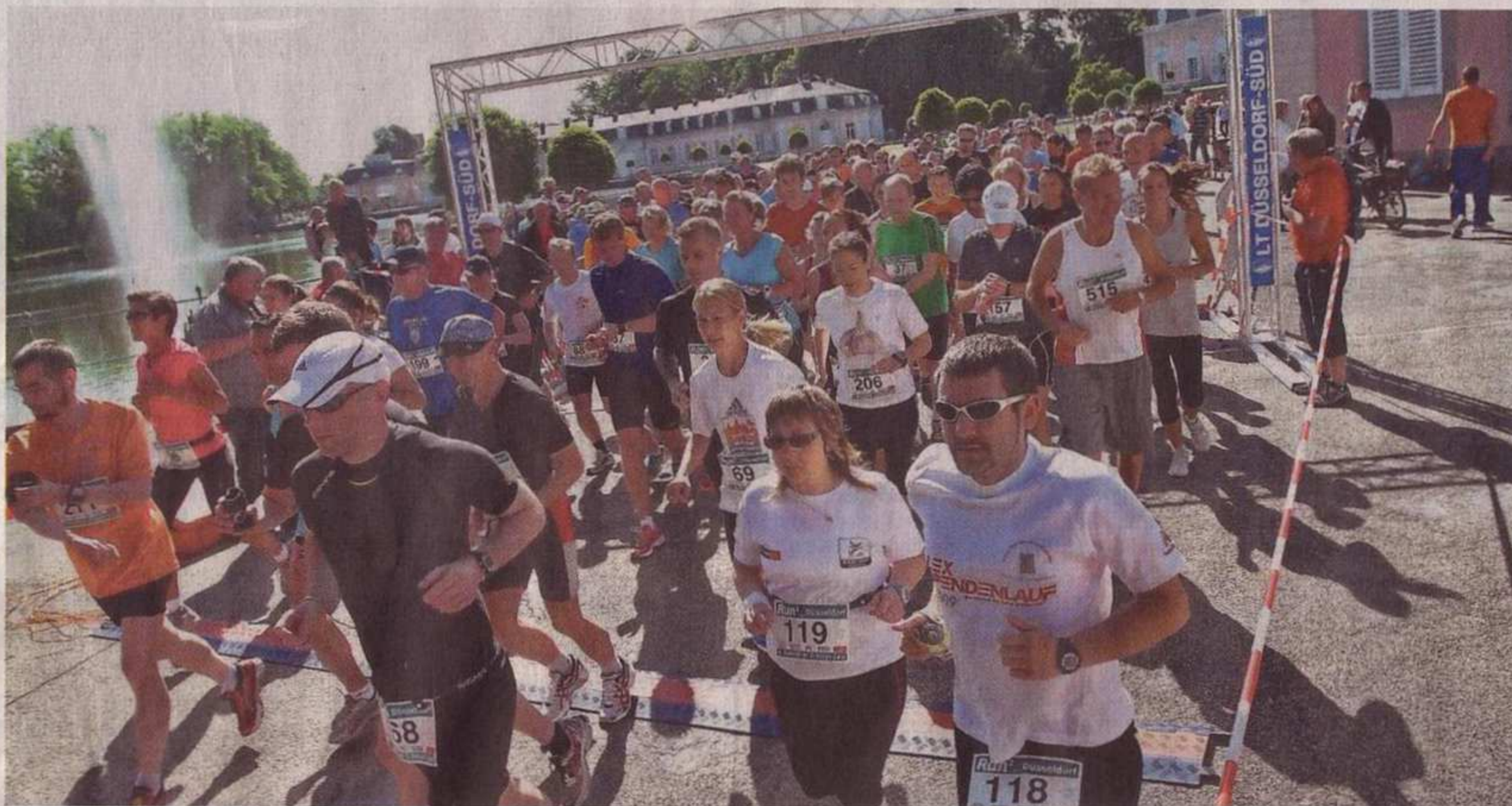
Großer Andrang herrscht beim Start zum zehn Kilometer langen Demag Cranes-Lauf.

1385 Freizeit-Athleten hatten die Laufschuhe angezogen und beteiligten sich am Benrather Schlosslauf. Bereits im Vorfeld gab es einen Rekord. So viele Anmeldungen zu dem Sport-Spektakel hat es noch nie gegeben.